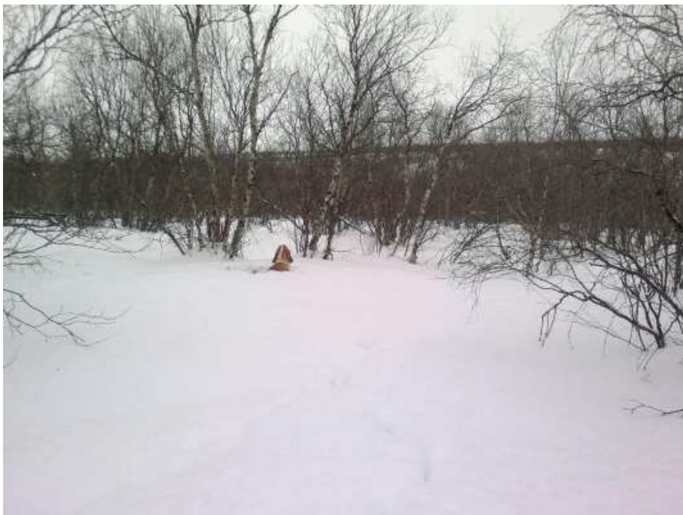
Caccia in Lapponia alle pernici bianche nordiche di Esuss della Bassa Brianxa