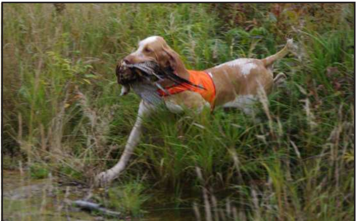
Finlandia: All'apertura della caccia Esuss della Bassa Brianza ha felicemente concluso una ferma su fagiano